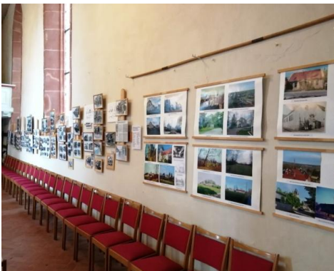
Kirche Osterhausen: Blick in die Fotoausstellung zur Ortsgeschichte