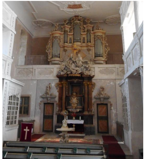
Nemsdorf, St. Georg, Rühlmann-Orgel im Gehäuse von H. Papenius (1719)